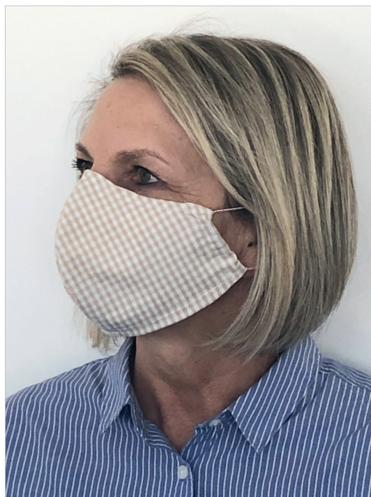
Na zdjęciu maska w rozmiarze L