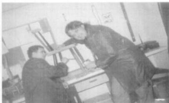
„Renowacja mebli” – zajęcia w stolarni

Podczas zajęć z zakresu obróbki drewna uczestnicy wykonują głównie przedmioty wykorzystywane w codziennym życiu: świeczniki, donice, ramy do prac plastycznych. Przedmioty te wykonane są bardzo estetycznie. Osoby uczestniczące w zajęciach w stolarni pełnią również rolę „konserwatorów” – dokonują w Domu drobnych napraw.