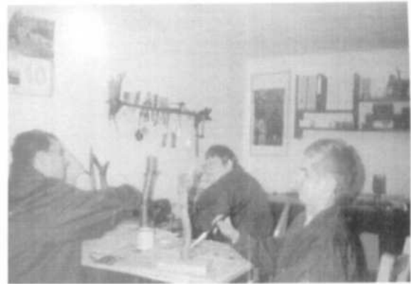
Zajęcia w stolarni

Rozważając problem bazy lokalowej i wyposażenia Domu należy wspomnieć również o otoczeniu budynku.