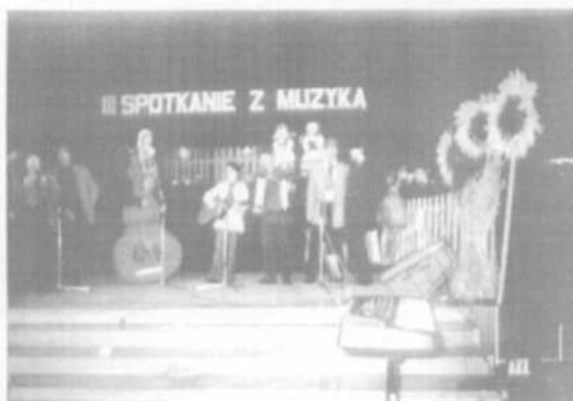
Występ zespołu „MALTA BAND” – OBORNIKI 2003

Popołudniami, w ramach zajęć świetlicowych organizowane są również warsztaty muzyczne.