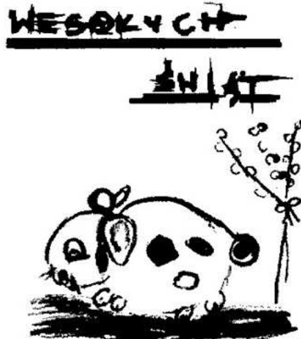
Rys. Hanna Siąkowska

Pracownicy i uczestnicy Domu Pomocy Maltańskiej w Puszczycowie