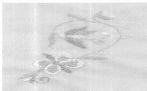
Haft wykonany przez H. Tokarską

Prace tej grupy: ozdobne poduszki, serwety,