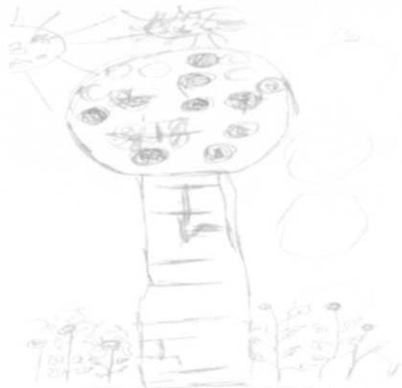
„wiosna” – Alicja Woźna