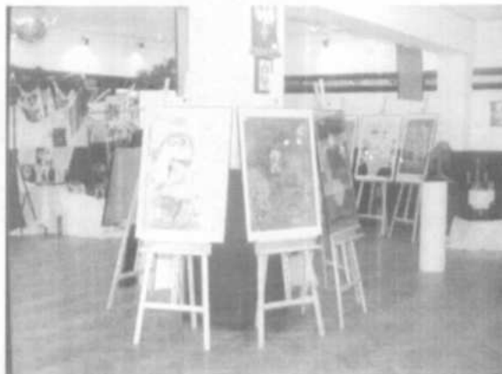
I Wystawa Prac Plastycznych Uczestników Domu Pomocy Maltańskiej w Puszczykowie zorganizowana przy współpracy z Mosińskim Ośrodkiem Kultury – marzec 2002

wykonywane są z dużym zaangażowaniem, ponieważ uczestnicy wykorzystują w nich