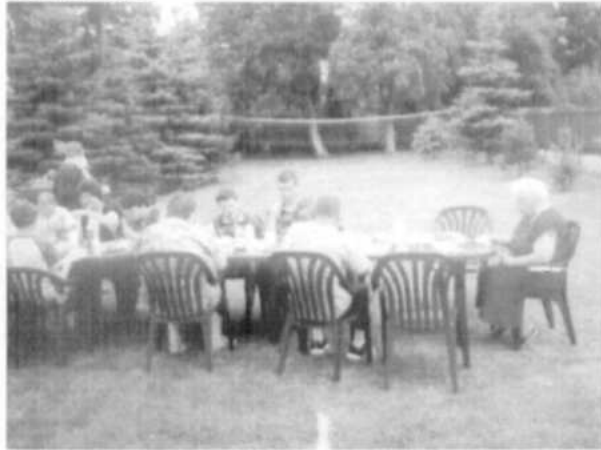
Popołudniowy odpoczynek w ogrodzie

Na przełomie roku 2000/2001 w piwnicy budynku zaczęto organizować pracownię stolarską. Z funduszy pozyskanych przez Fundację zakupiono narzędzia służące do obróbki drewna, a także farby, bejce i lakiery umożliwiające utrwalanie gotowych wyrobów uczestników.